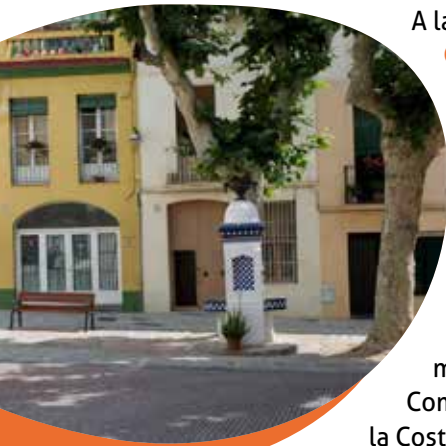
Plaça de la Constitució (Dalt la Vila)

Seguint l'avinguda de Martí Pujol fins el carrer de Barcelona «entrarem» al barri de Dalt de la Vila , l'espai que va ocupar Badalona fins a final del segle XVIII, al mateix lloc on al darrer quart del segle I aC es va fundar la ciutat romana de Baetulo.