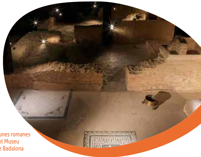
Runes romanes del Museu de Badalona

Seguint, de camí al parc de Can Solei-Ca l'Arnús , passarem per davant l'edifici del Museu de Badalona . Va ser edificat sobre les restes de l'antiga ciutat romana de Baetulo, actualment és una de les superfícies arqueològiques més importants de Catalunya.