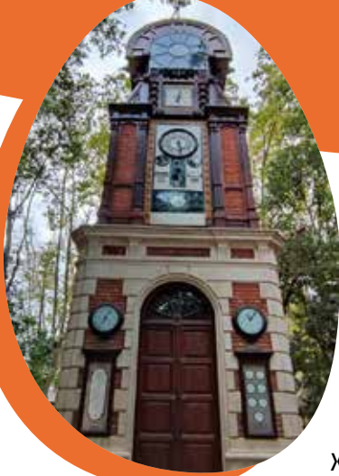
Torre del rellotge

Caminarem pel jardí romàntic de can Solei i veurem les dues cases del segle XIX. Seguint el passeig arribarem a la que va ser la finca de Ca l'Arnús, i en veurem la casa edificada per Evarist Arnús, la Torre del Rellotge , el Jardí Romàntic i el Castellet .