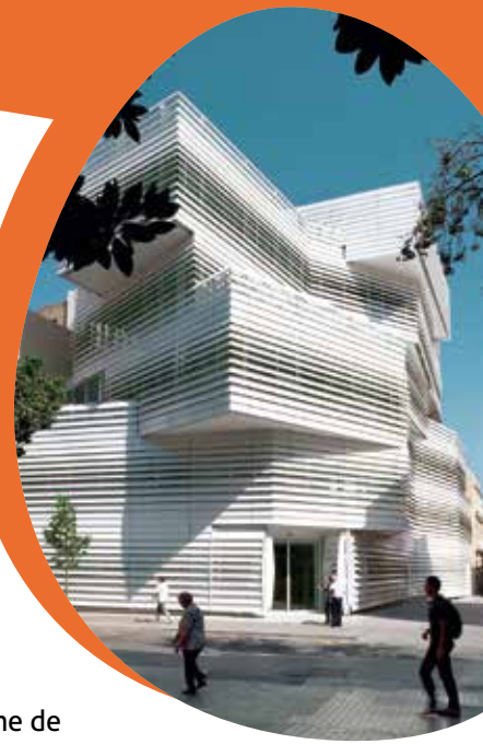
Edifici d'El Carme

veurem l'edifici El Carme , un edifici singular en la seva arquitectura (Martínez Lapeña-Torres Arquitectos, 2009-2012) que ocupa la Universitat de Barcelona i on hi ha l'Oficina de Turisme de Badalona i una sala d'exposicions.