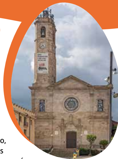
Església de Santa Maria

Seguint, de camí al parc de Can Solei-Ca l'Arnús , passarem per davant l'edifici del Museu de Badalona . Va ser edificat sobre les restes de l'antiga ciutat romana de Baetulo, actualment és una de les superfícies arqueològiques més importants de Catalunya.